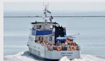
Nordsee Rundfahrt durch den Jade-Weser-Port